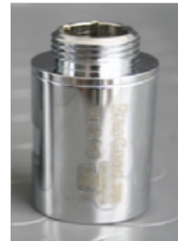
ATK per elettrodomestico ( attacchi 3/4" )

Per tutta la serie ATTACCHI: a vite da 1/2" fino 2" mm TENUTA: o-rings certif. DVGW (DinEn549) NUCLEO: cartuccia in polyethylene neutro alimentare con magneti NEODIMIO scarpa magnetica (>14.000Gauss) PORTATA: da 18 a 210 lit/min PRESSIONE: bar 25 TEMP. MAX: C. 100° CERTICAZIONI: CE TUV SVGW - SSIGE - SSIGA - SGWA