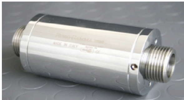
ATK in acciaio inox centralizzato

per lavatrice lavastoviglie boiler per tutta la casa